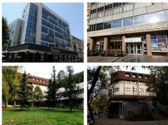
Hoteli "Grand", "Ambasador", "Ozren" i "Partizan"

Utorak, 05. 05. 2015. | 16:03