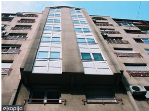
Budući izgled bazena u Šapcu

Subota, 16. 05. 2015. | 14:06