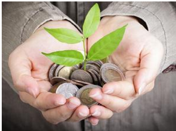
Futurističko naselje - budući izgled

Ponedjeljak, 08. 06. 2015. | 11:04 | Izvor: Tanjug