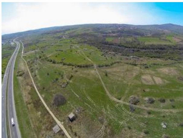
Lokacija Bubanj potok gde će biti izgrađena prva IKEA robna kuća u Beogradu

Sreda, 10. 06. 2015. | 14:34 | Izvor: eKapija