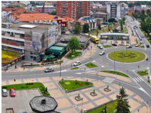
Loznica (foto: loznica.rs)

Petak, 15. 05. 2015. | 11:25 | Izvor: eKapija