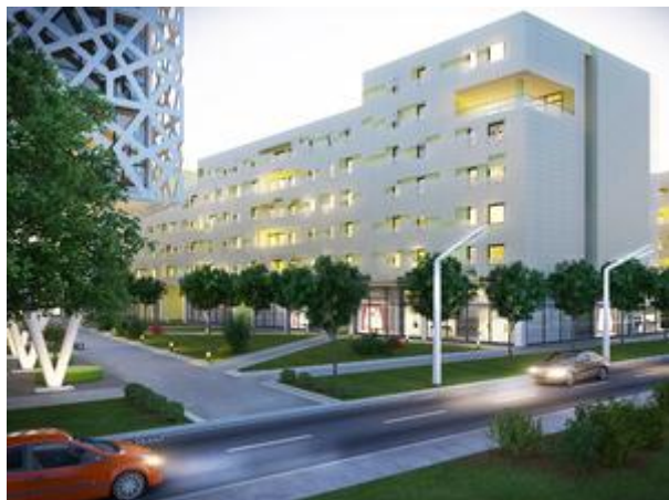
Budući izgled centra Leskovca

Četvrtak, 04. 06. 2015. | 16:01