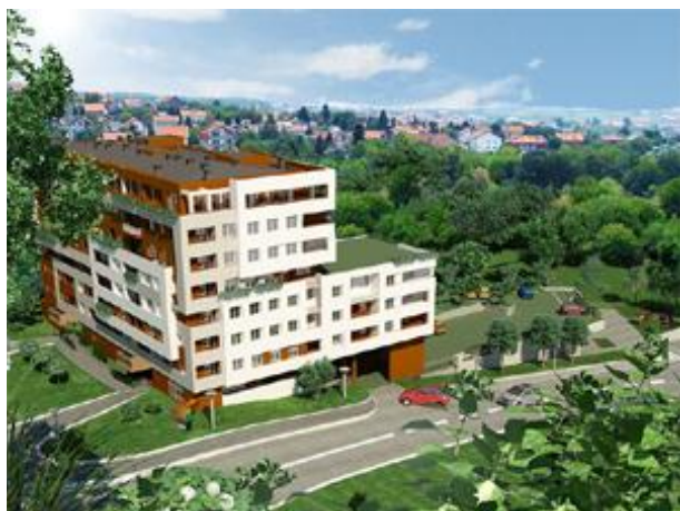
Izgled budućeg kompleksa "Paunov breg"

Četvrtak, 02. 05. 2013. | 12:50