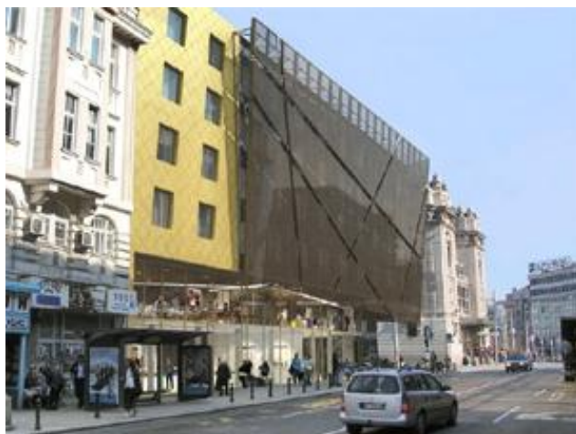
Izgled budućeg hotela "Marriott"

Četvrtak, 09. 05. 2013. | 13:55 | Izvor: eKapija