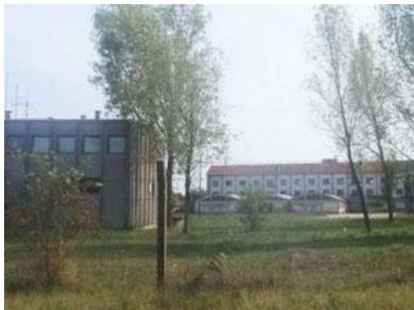
Bivša kasarna u Kanjiži

Ponedjeljak, 29. 04. 2013. | 10:33