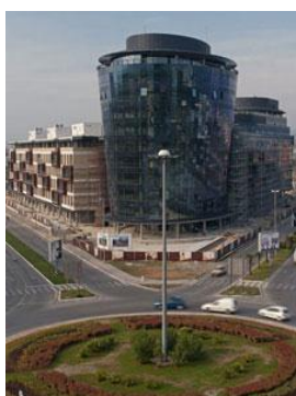
Sa gradilišta - veći deo radova je završen

"Atlas Capital Centar" predstavlja spoj poslovne, komercijalne i rezidencijalne zone, ukupne površine od oko 93.000 m 2 . Smešten je u centralnom delu grada, preko Morače. Granice lokacije na kojoj se nalazi zapravo su ulice Cetinjski put, Bulevar Ilije Plamenca i Ljubljanska. Osim toga, objekat je kružnim tokom direktno povezan i sa Bulevarom Džordža Vašingtona i Bulevarom Revolucije.