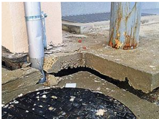
Zgrada useljena u julu 2012.

Četvrtak, 13. 06. 2013. | 16:07 | Izvor: eKapija