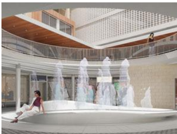
Šoping zona u stilu mediteranskih trgovina